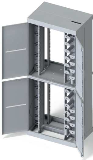
CARMA Kollokationsrack 1/2